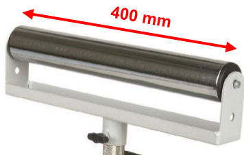
MS 1 R: Rollenauflage Universell einsetzbar Tragfähigkeit: 70 kg