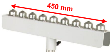
MS 1 K: Kugelaufgabe für Längs- und Seitenbewegung: Tragfähigkeit: 70 kg