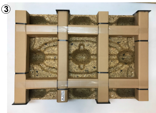
Abb. 2: Tischbeine und Beschlagbeutel mit Holzschrauben