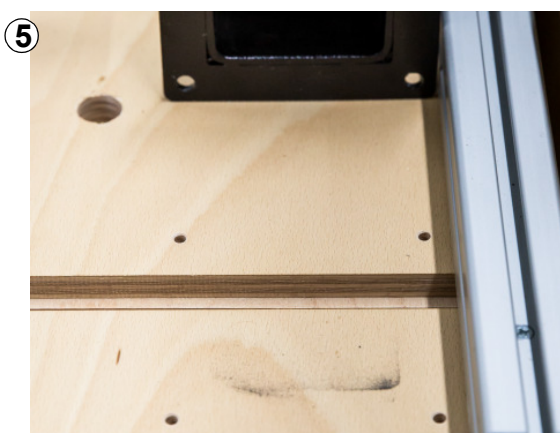
Abb. 3: Tischbein anhalten