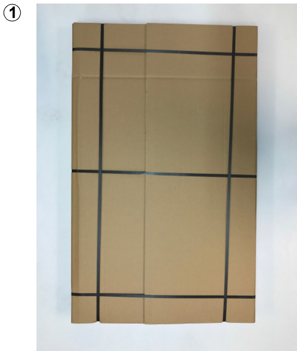
Abb. 1: Anlieferung: Palette mit Tischplatte, darunter Tischbeine