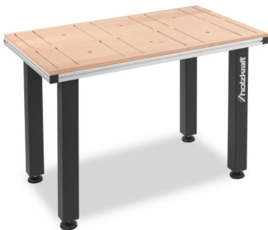
MAT 200 H