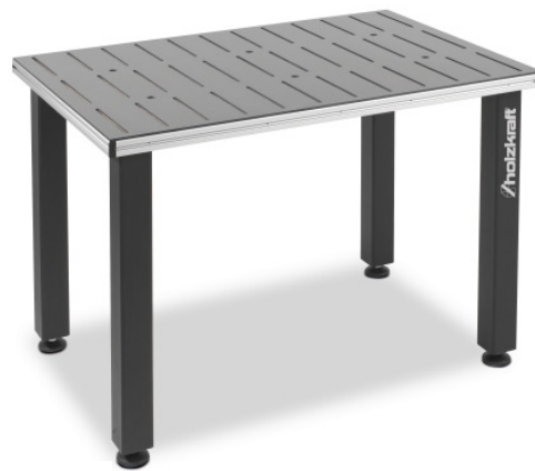
MAT 300 K